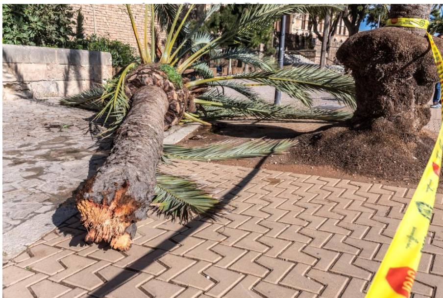
Detalle del quiebre de palmera