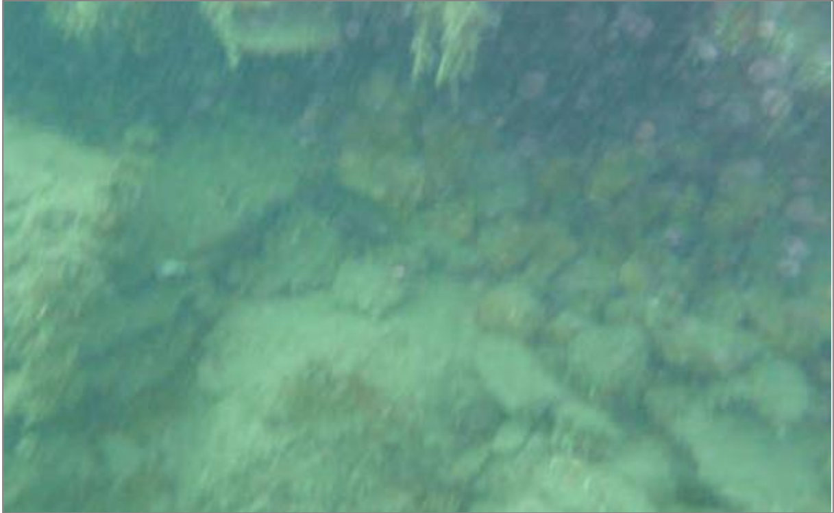
Figura 3. Instantánea de la problemática de descalces en el pie del muelle

Por dicho motivo, se va a realizar un reconocimiento geotécnico en el trasdós del muelle, el cual tendrá por objeto la identificación de las condiciones del relleno de este, así como del terreno natural que se encuentra por debajo.