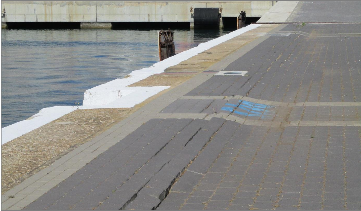
Figura 1. Instantánea de la problemática de asentamientos en el pavimento adosado al muelle