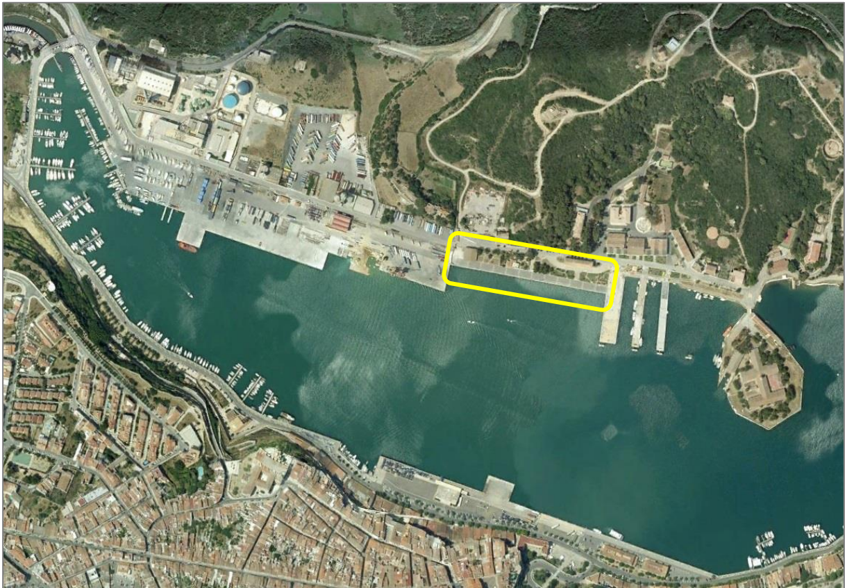
Figura 1. Vista del Puerto de Maó. En amarillo, ubicación del muelle militar.

A continuación, se muestra una fotografía satelital del puerto de Maó y de la ubicación del muelle de la Base Naval.