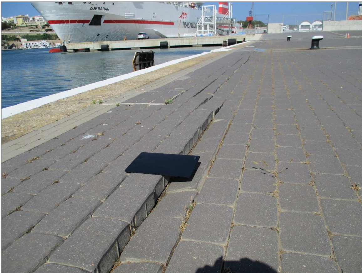
Figura 2. Medición de asentamientos en el pavimento adosado al muelle