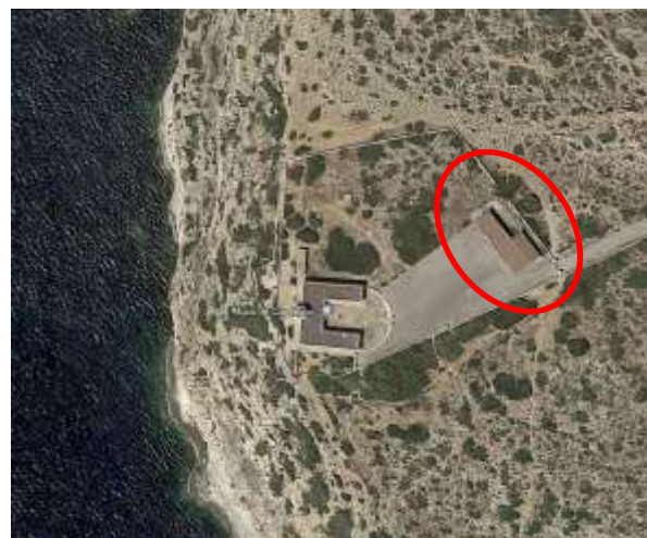
Planta del faro de Cap Blanc. Edificio auxiliar.

Los gastos de transporte y de cualquier otra clase para la entrega de dicho material se consideran incluidos en la partida correspondiente.