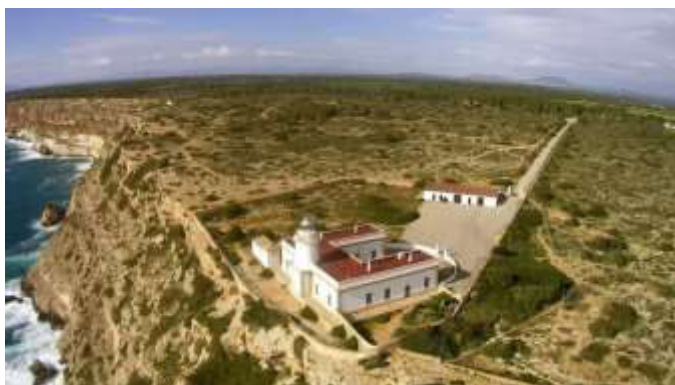
Vista aérea del faro de Cap Blanc y edificio auxiliar.