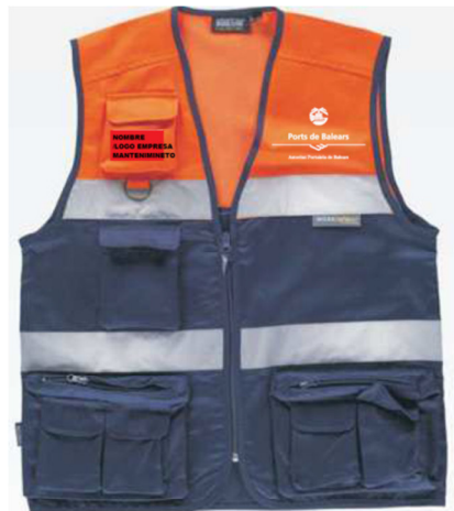
Ample logo empresa: 5 cm Ample Logo Ports: 10 cm