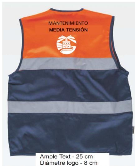
Ample Text - 25 cm Diàmetre logo - 8 cm

Equipos de trabajo: los operarios deberán disponer de todos los elementos necesarios para desempeñar adecuadamente su trabajo, siendo el suministro y mantenimiento de los mismos a cargo del adjudicatario.