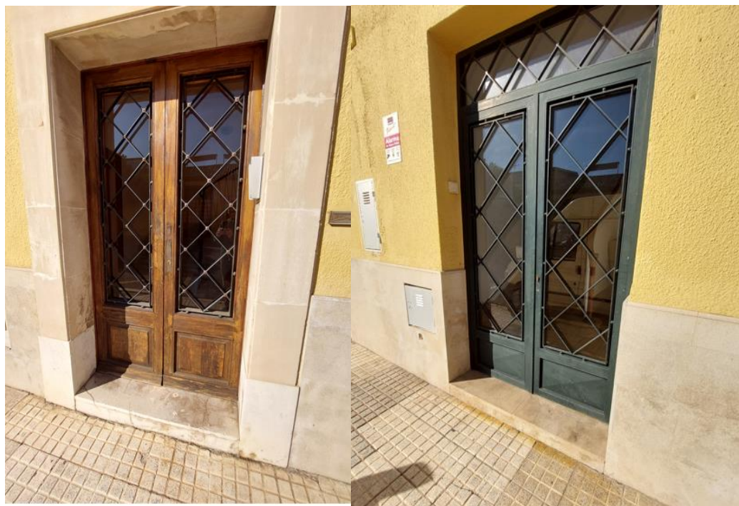
Fotografía de la puerta de madera deteriorada y puerta contigua del mismo edificio

Se sustituirá la puerta de acceso al edificio (actualmente de madera muy deteriorada por haber sufrido diferentes episodios de carcoma) por una puerta de hierro perfisa PDS, de las mismas características de la empleada en la puerta nº 10 del mismo edificio.