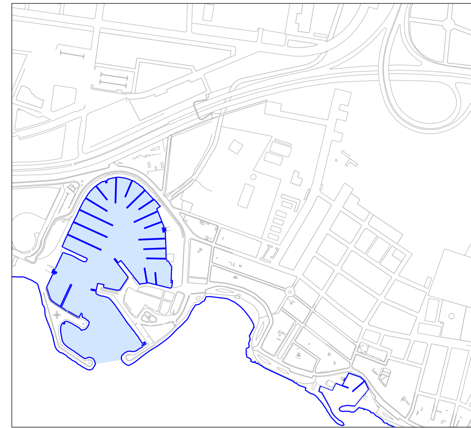
PORTITXOL Y MOLINAR DE LEVANTE