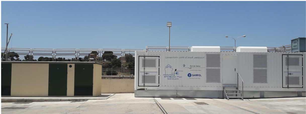
Centro de Transformación y Subestación OPS