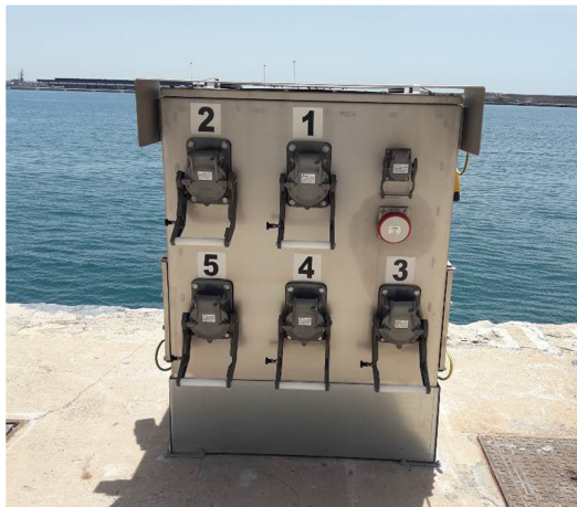
Cuadro de Tomas de BT