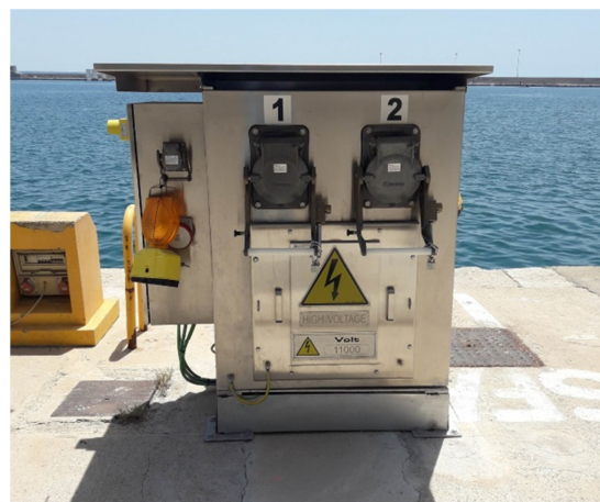
Cuadro de Tomas de MT