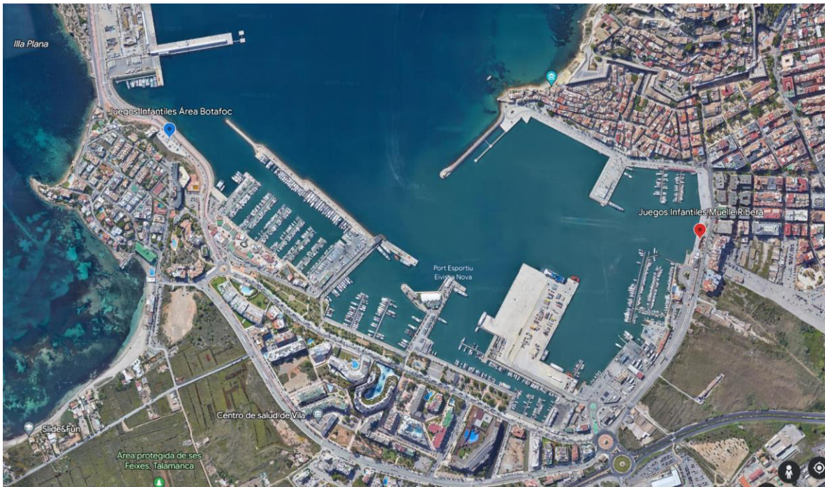
Ubicación geográfica áreas de juegos infantiles Puerto de Eivissa.