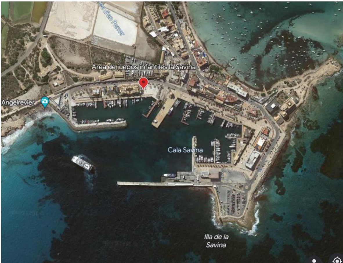
Ubicación geográfica área de juegos infantiles Puerto de la Savina.