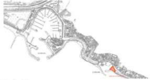
Emplazamiento de las obras