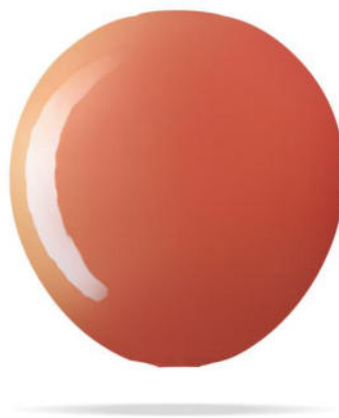
Ilustración 1. Baliza CCRS-4