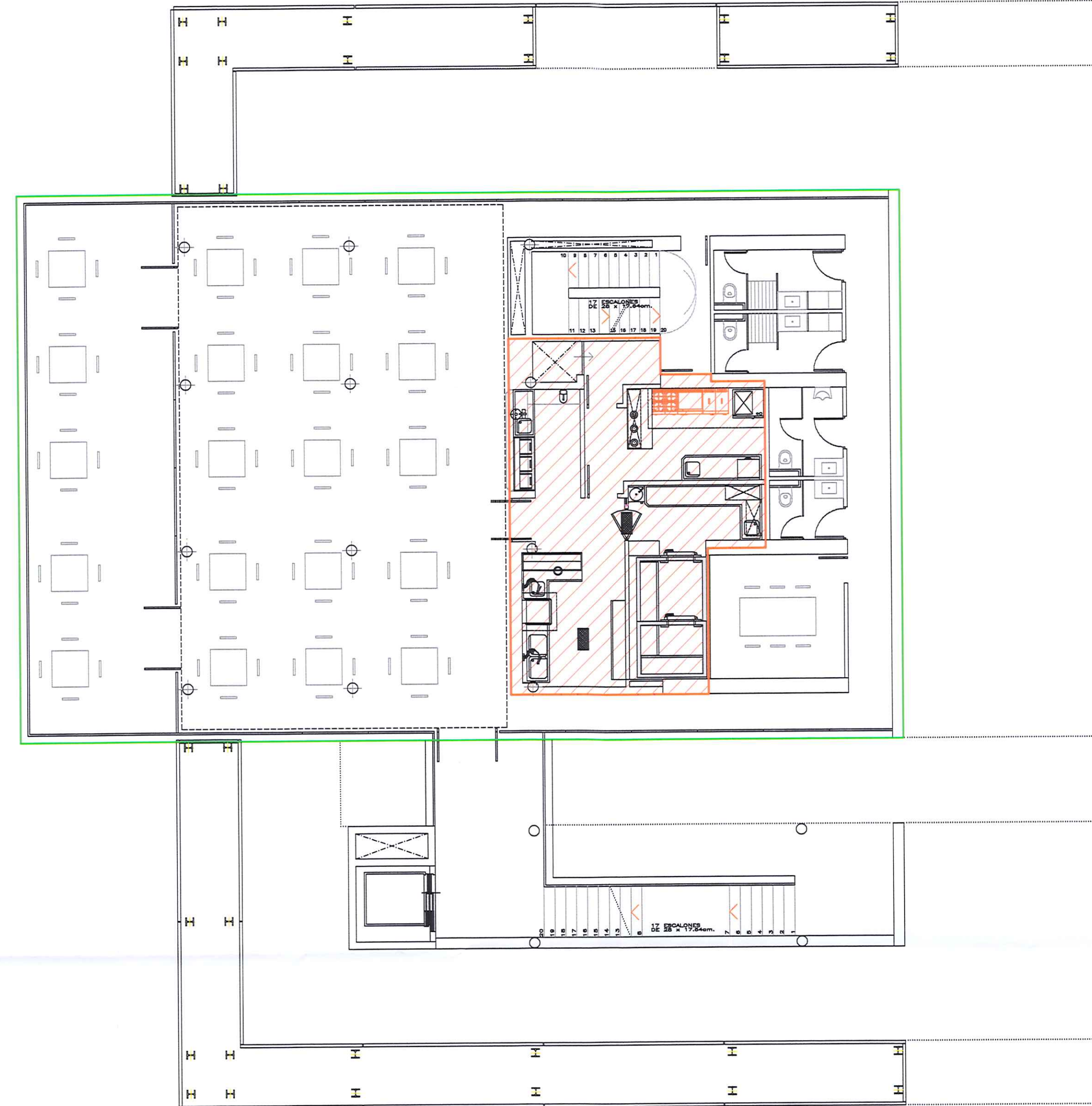
PLANTA PISO Escala 1/100